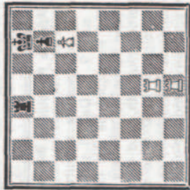
MAT N° 1 C

Enfin, l'une des parois du Couloir peut n'être pas nécessairement formée de PN. Un PB, une figure blanche, peuvent garder les cases qu'obstruent les P dans notre schéma.