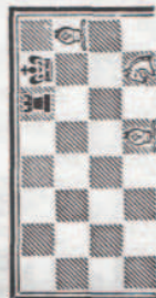
TABLEAU DU MAT 7 A