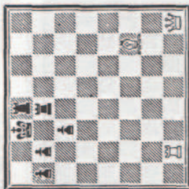
MAT N° 6 A