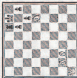
MAT N° 7 A

Pour forcer cette position, l'assaillant ne doit pas hésiter à sacrifier des pièces, fut-ce la D. Voici une position schématique type :