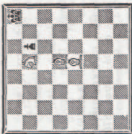
TABLEAU DE MAT 7 C

Il va de soi que des variantes sont possibles. Exemple :